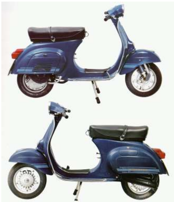
Blu Marine MaxMayer 1.298.7275

“VESPA 125 Primavera ET3 – 1976/1983 VMB1T Numero di esemplari prodotti: 144.211