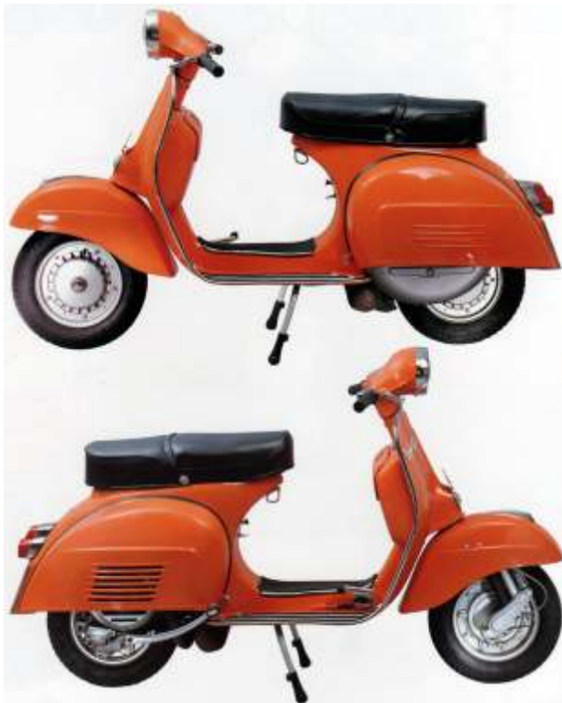
Giallo Arancio MaxMayer 1.298.2916

“VESPA 180 Rally – VSD1T 1968/1973 Numero di esemplari prodotti: 26.495